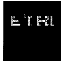
그림 1. BCGH와 시각 암호화를 이용하여 보호하고자 하는 영상

아래 그림은 BCGH를 이용하여 복원된 영상을 나타낸 것이다. 그림 1은 제안한 방법을 이용하여 보호하고자 하는 영상으로 회색 준위를 갖고 있어 시각 암호화 기법을 직접 적용할 수는 없다.