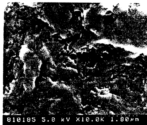
그림 3. 플라즈마 멤브레인의 기판