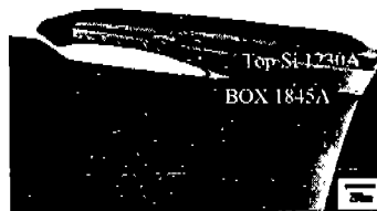
그림2. As-bonded SOI wafer 표면에 존재하는 결함의 X-TEM 상