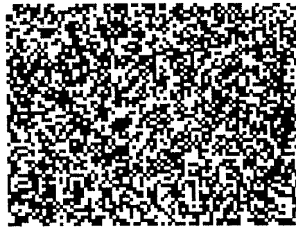
그림 5. 이미지 처리를 통해 복원된 이진 영상 (84×64 : 4배 확대).