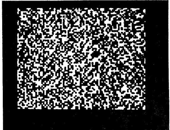
그림 4. 각도 다중화를 통해 저장 복원한 이진 영상 (640×480 : 0.7배).

통해 영상의 회전과 크기 조정이 필요하며 다시 이진 영상으로 만드는 작업도 수행되어야 한다. 디지털 홀로그래프 메모리 시스템을 구성하기 위해 이러한 영상을 다른 image processing program을 거치지 않고 순차적으로 이미지 처리와 디코딩이 이루어질 수 있도록 프로그램을 구현하였으며 이 시스템을 이용해 재생된 영상을 그림 5에 나타내었다.