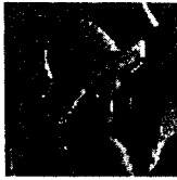
그림 2. 입력 영상 (64×64 Lena image : 2배 확대).

그림 2는 아날로그 입력 영상으로 쓰인 Lena 영상이다. 이 영상의 한 픽셀의 정보가 RS 부호에서의 한 심볼이 된다. RS(84,64) 부호로 인코딩 한 결과를 이진화하여 그림 3에 나타내었다.