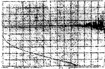
그림 3. 감쇄량과 delay time 과의 관계