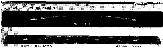
그림 1. 냉장고 제어표시판의 프로토타이프