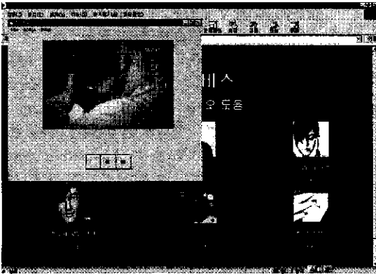
그림2. 실시간 멀티미디어 재생기 실행화면

클라이언트와 서버의 프로그램 동작은 우선 로그인을 위한 홈페이지로 접속한 후 접속에 성공하면 VOD 홈으로 들어오게 된다. 그후 홈에 있는 Movie를 클릭해 주면 실시간 미디어 재생기가 실행되고 서버는 사용자가 요구한 파일 전송을 준비한 후 Play 신호가 오기를 기다린다. 클라이언트로부터 Play 신호가 오면 서버는 저장된 프레임들로 데이터 채널을 통해 비디오 프레임을 전송한다. 이때 비디오 프레임은 패킷 형태로 전송되는데 사용하는 패킷은 8192byte의 크기를 가진다. 한 프레임의 크기가 하나의 패킷 크기보다 큰 경우 여러 개의 패킷으로 나누어져 전송되는데 각 패킷은 자신이 한 프레임의 부분임을 나타내는 필드를 이용하여 프레임으로 재결합된다. 클라이언트에서 수신된 각 프레임들은 적절한 버퍼링 지연 후에 재생된다. [6] 사용자가 선택한 비디오 스트림을 전송받아 실시간으로 재생하는 클라이언트 시스템이 그림2에 나타나 있다. 현재 이 실시간 미디어 재생기는 Play, Stop, Pause 기능만이 가능하다.