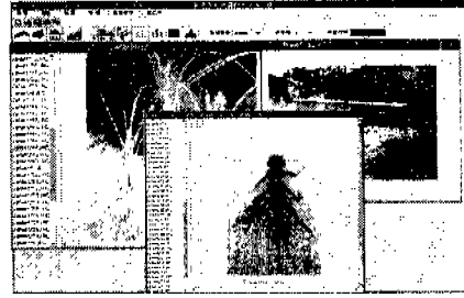
[그림 4] 하천환경관리 예