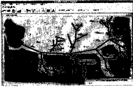
[그림 3] 하천 오염도 및 오염원도 예