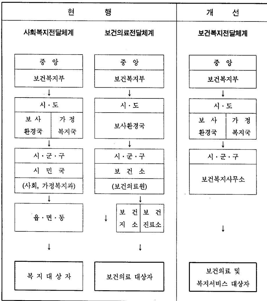
<그림 1> 示範保健·福祉 傳達體系 比較

향후 본 사업의 시행시 예상되는 복지 서비스 수행상의 여건변화를 예측하여, 효율적인 운영방안 및 제도를 개발하고, 보건과 복지의 통합 서비스체제 마련에 따른 문제점을 파악하여 지역주민에 대한 포괄적인 보건·복지 서비스의 제공체계를 마련한다. 또한 시범 보건복지사무소와 관련기관, 인력, 제도간의 소관업무를 명확히 하고, 업무수행 연계체제를 체계화한다.