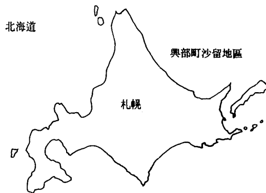
〈圖 3〉興部町沙留地區의 位置