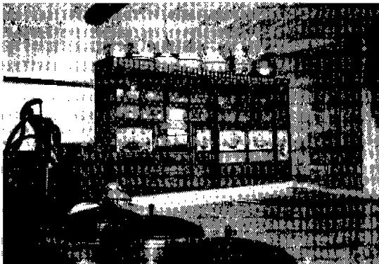
<사진 1> 명동촌 장추길 씨대

조사대상농가의 주택 특성은 <표 3>과 같다. 건축연대를 보면 개척단 시대인 1866년